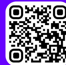
ПЕДАГОГИЧЕСКОЕ ИЗДАНИЕ «КНИГА ВОЖАТОГО»