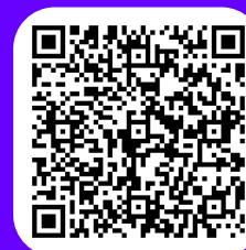
ПРИМЕРНАЯ РАБОЧАЯ ПРОГРАММА ВОСПИТАНИЯ