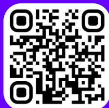
ПОВЫШЕНИЕ КВАЛИФИКАЦИИ В ФЕДЕРАЛЬНЫХ ДЕТСКИХ ЦЕНТРАХ